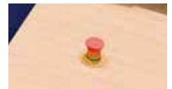
Seta de emergencia