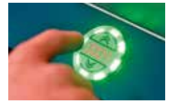
Botón de confirmación